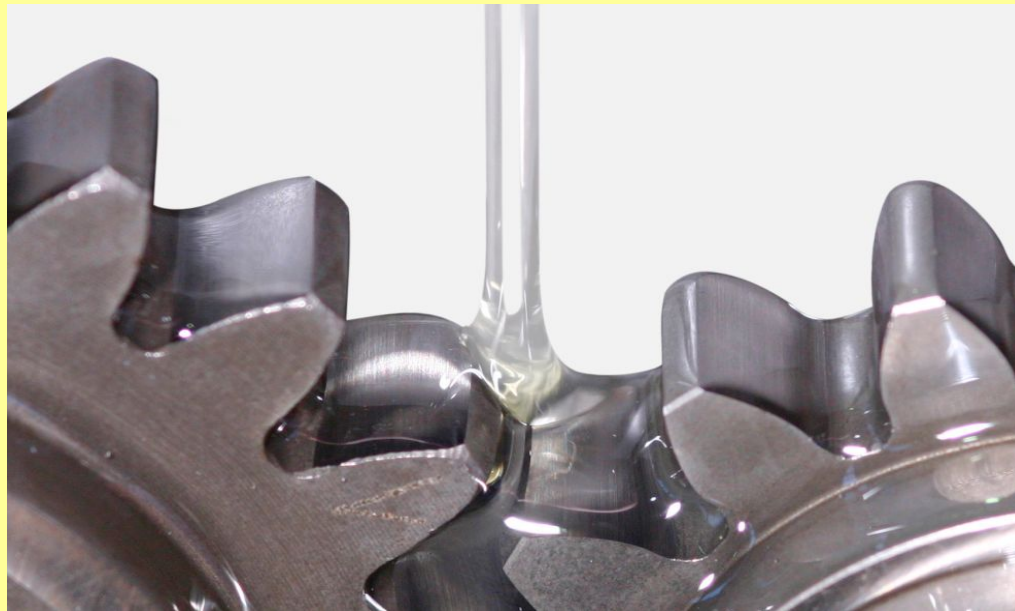
Tabelle A-d 'Biologisch abbaubare Öle für FLENDER Stirnrad-, Kegelrad-, Planetengetriebe und 'Marinegetriebe ohne Lamellenkupplung'

Table A-d Biologically degradable oils for FLENDER helical, bevel-helical, planetary gear boxes and 'Marine gear units without multi-disk clutches'